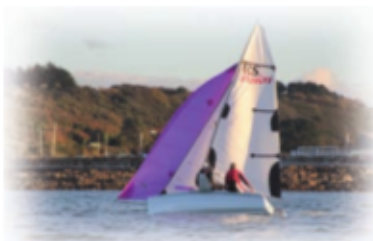
Le RS VISION