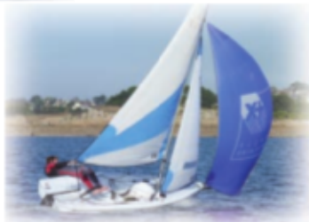
Le RS FEVA